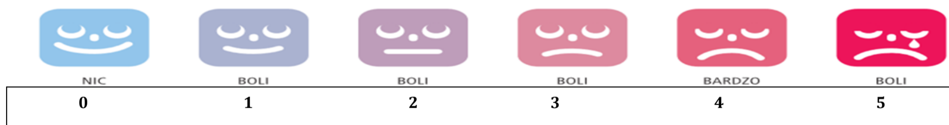
Ryc. 2 Skala numeryczno-wizualna- stosowana dzieci

U dzieci do monitorowania natężenia bólu stosuje się skalę numeryczno-wizualną.